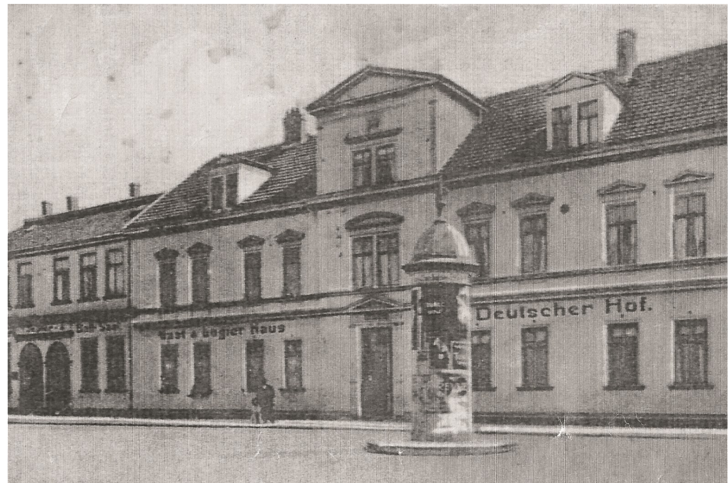
Ansicht des Deutsches Hofes um 1912

In den Jahren 2020/21 richtete man im Saal des ehemaligen Gasthofes eine DDR-Ausstellung ein, die heute neugierige Besucher in die Salinenstraße 150 anzieht.